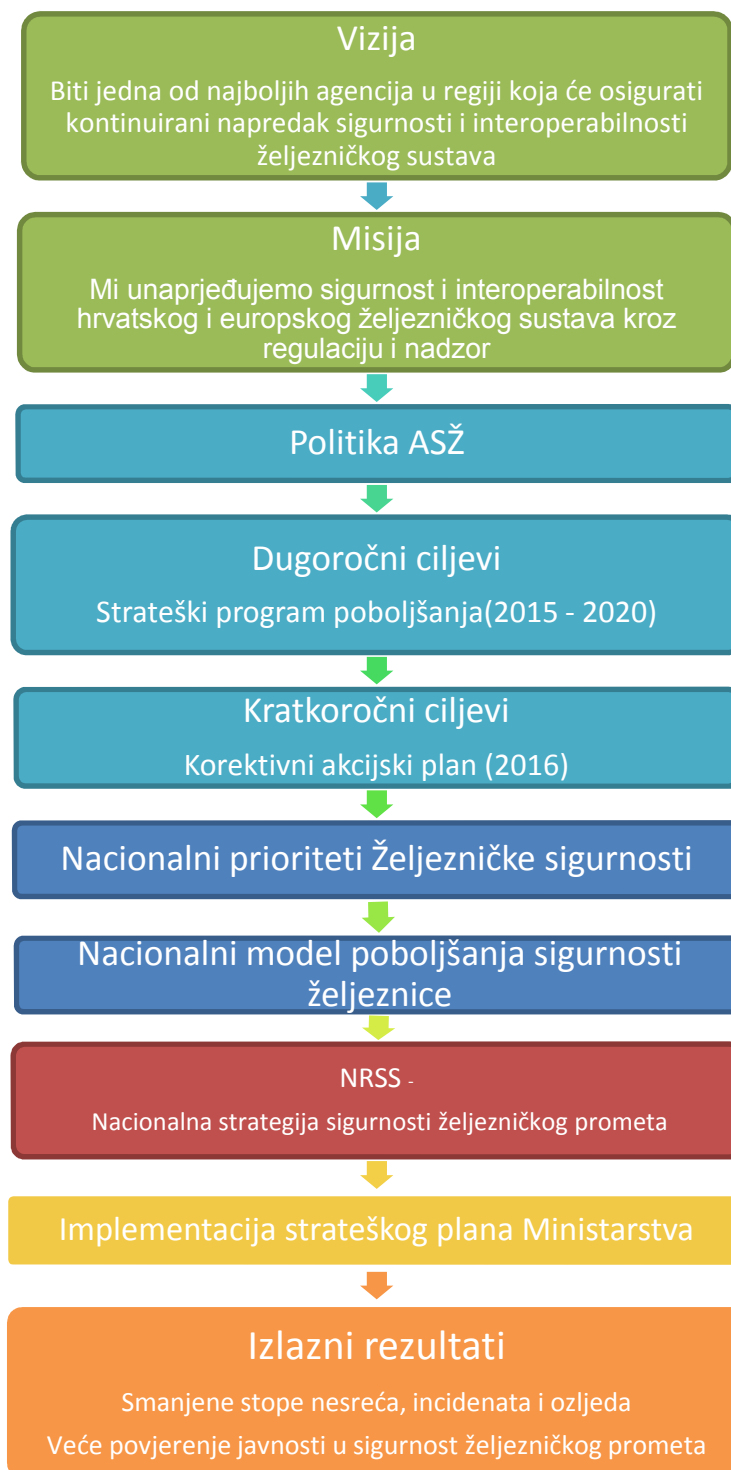
Slika 3 – Model dugorčnih ciljeva