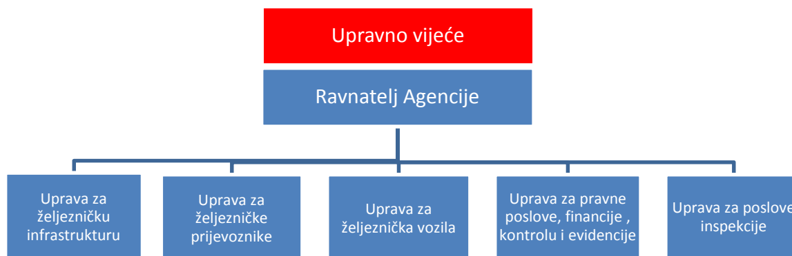
Slika 2 – Organizacijska struktura Agencije (u skladu s novim Statutom Agencije, na snazi od dana 24. rujna 2015. godine)

Statut uže određuje organizaciju, nadležnosti i odluke tijela Agencije, te uređuje druga pitanja od značaja za obavljanje djelatnosti i poslovanje Agencije.